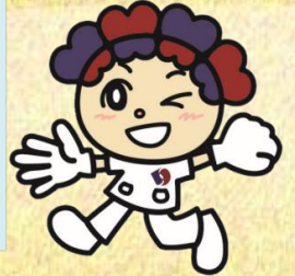
公式キャラクター てっでい